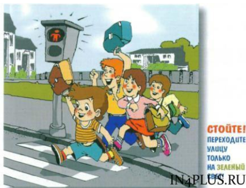
7. идти на красный свет светофора