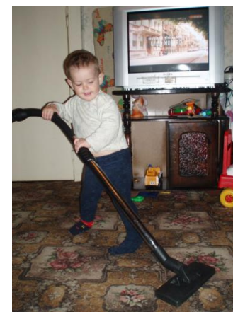
6. помогать маме