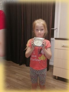
Рассказ о часах