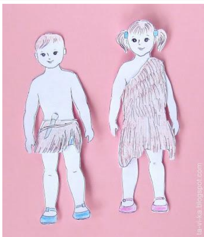
Одежда бронзового века