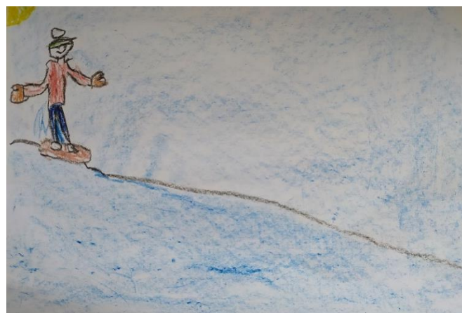
«Катание на сноуборде»