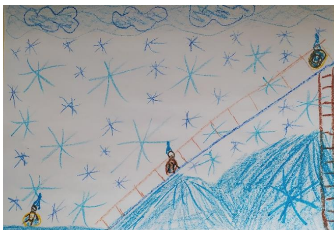
«Катание на ватрушках»