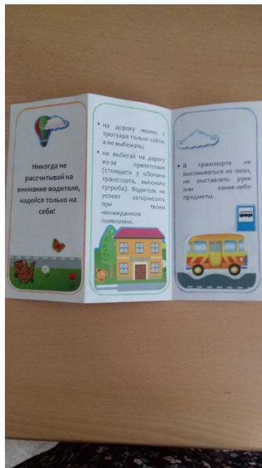
Яковлев Вова Группа № 6