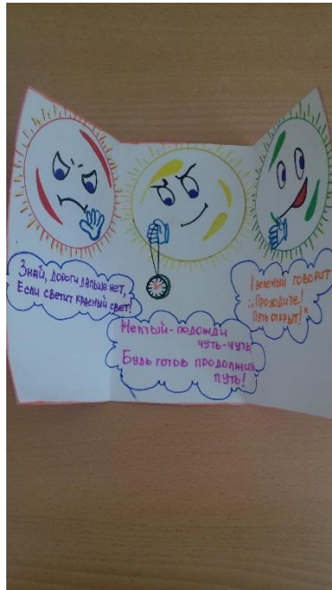
Королева Кира Группа № 6