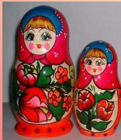
Полховско – Майдановская матрёшка