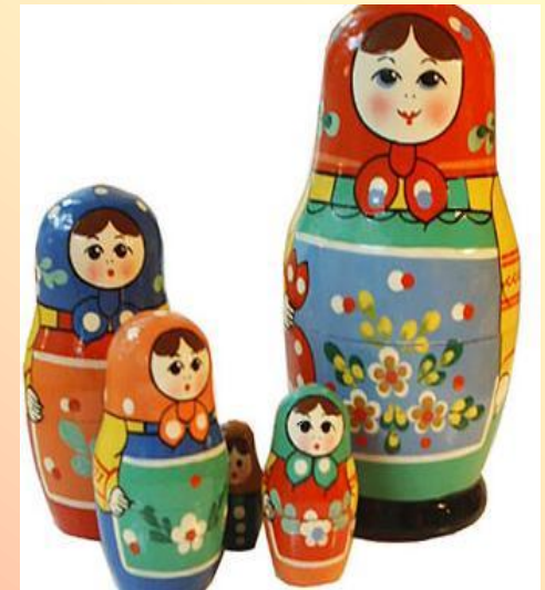
Сергиев – посадская матрёшка