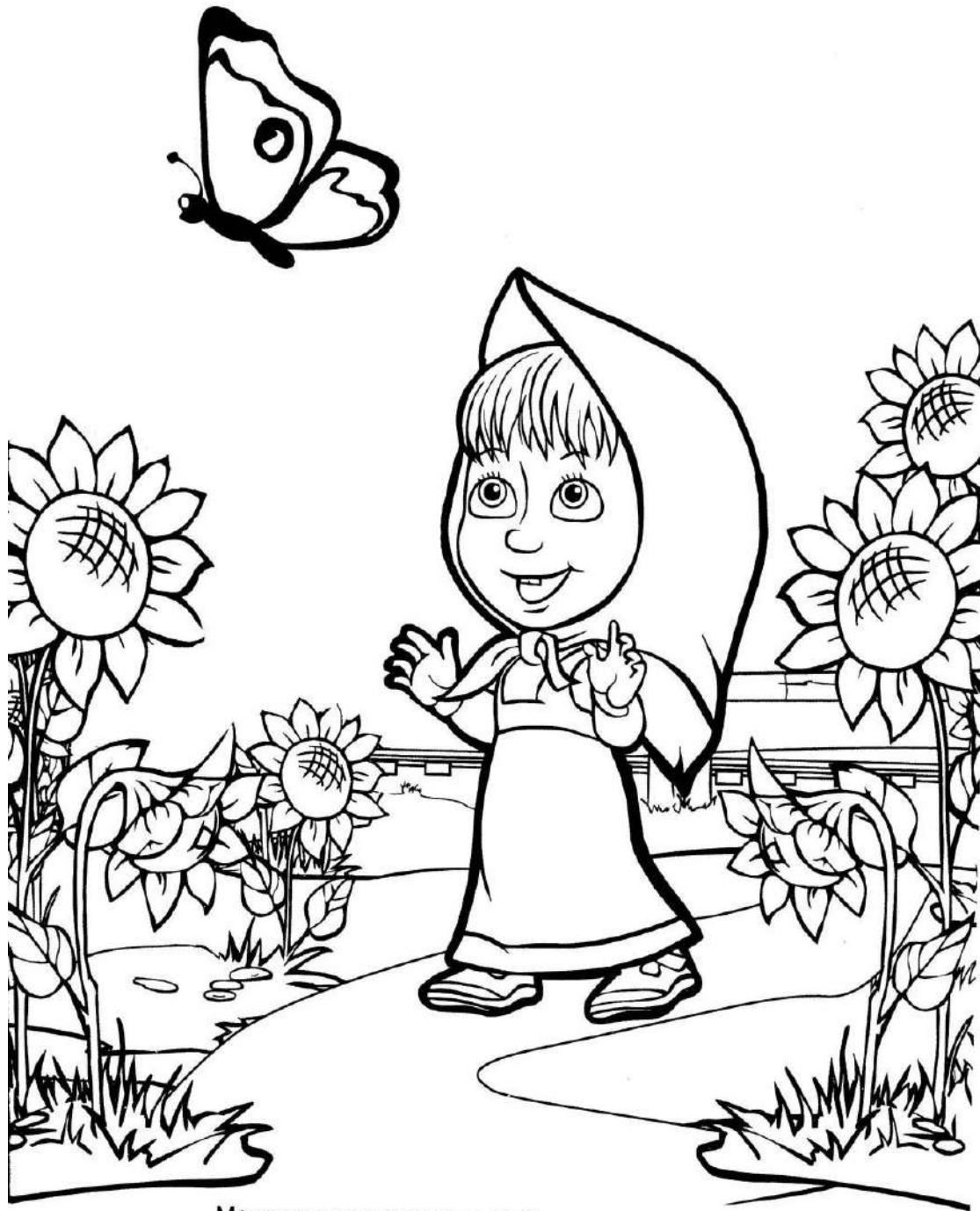
Маша увидела красивую бабочку и стала её ловить.